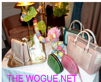
Haute Couture: Luxury Bags

soprattutto il futuro prossimo relativo. La tradizione italiana, Made in Italy, con la simbiosi di una