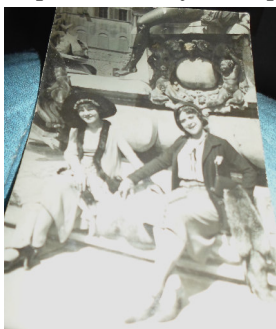
La vecchia Generazione di The Wogue.net

soprattutto il futuro prossimo relativo. La tradizione italiana, Made in Italy, con la simbiosi di una