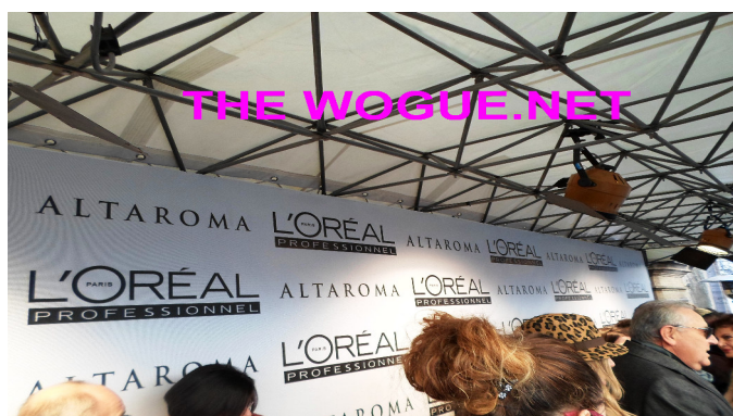
ALTA ROMA: RED CARPET

globalizzazione delle idee sia innovative che della storia di paesi del vecchio mondo e nuovo.