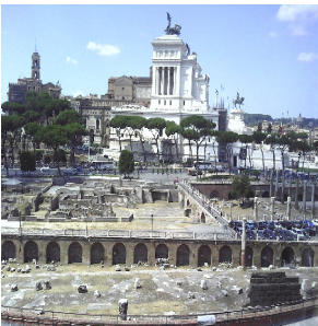
Piazza Venezia dal Foro di Traiano Roma Italia. By Linda Eyes

"L'ESSENZA E' ANDARE OLTRE TRA REALTA' E FILOSOFIA"